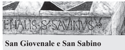
San Giovenale e San Sabino

Il Duomo di Orvieto custodisce il Reliquiario del cranio di S. Savino , pregevole opera piramidale di rame dorato di architettura gotica di artisti senesi del 1340, ornata di smalti su argento con figure che narrano sei episodi della vita del Santo Vescovo di Canosa. Il reliquiario di altezza cm.105 si presenta