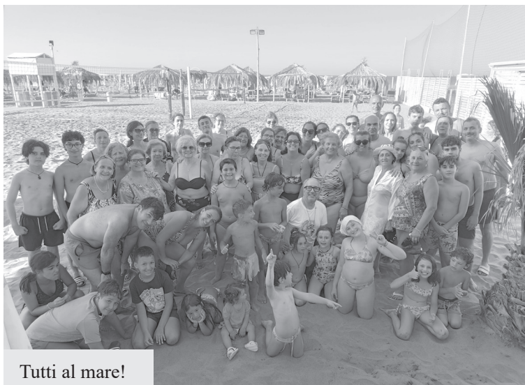
Tutti al mare!