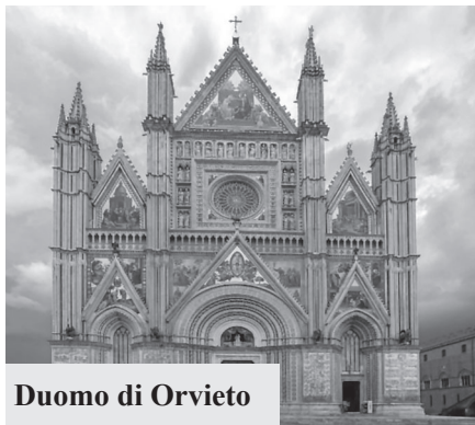
Duomo di Orvieto