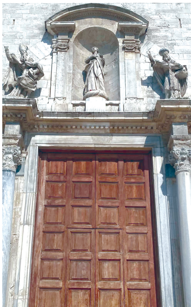
Portale della Cattedrale di Bari: San Sabino, l'Assunta e San Nicola

Subito dopo Probo, diventa Vescovo Rufino (...). Durante il suo episcopato si riaccese un nuovo conflitto contro la Sede di Roma. "È evidente, scrive Giorgio Otranto, che dopo l'intensa attività di Probo in favore della Chiesa Romana, i rapporti tra questa e Canosa si erano notevolmente consolidati: i Papi Ilario, Simplicio, Gelasio e Simmaco devono aver tenuto in grande considerazione la diocesi pugliese, che intanto era divenuta una delle più prestigiose dell'Italia suburbicaria e che, di lì a poco, avrebbe espresso in Sabino il suo più illustre rappresentante" (p.161). Anche Rufino dà un enorme contributo all'unità della Chiesa e al riconoscimento di Papa Simmaco contro l'antipapa Lorenzo, e partecipa attivamente al Sinodo convocato dal Pontefice per sancire i canoni per le future elezioni dei Pontefici. Questo spiega perché negli Atti ufficiali, subito dopo la firma del Papa Simmaco e di tre vescovi, che erano cardinali, è apposta anche la sua firma: Rufinus episcopus ecclesiae canusinae subscripsi. A Rufino, come Vescovo di Canosa, succedette un altro grande Vescovo, Memore (...).