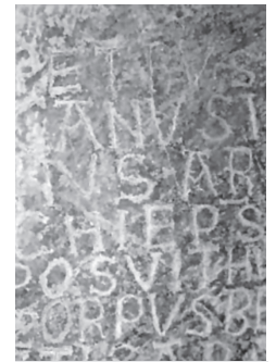
Iscrizione cripta di S. Sabino

L'opera viene suggellata dal Logo della Cattedrale di San Sabino a firma di Mons. Felice Bacco nei giorni del 40° Anniversario dell'Ordinazione Sacerdotale e con la concessione in dignità del logo dell'Opera del Duomo di Orvieto e logo della Diocesi di Orvieto (SANCTA URBEVETANA TUDERTINA ECCLESIA).