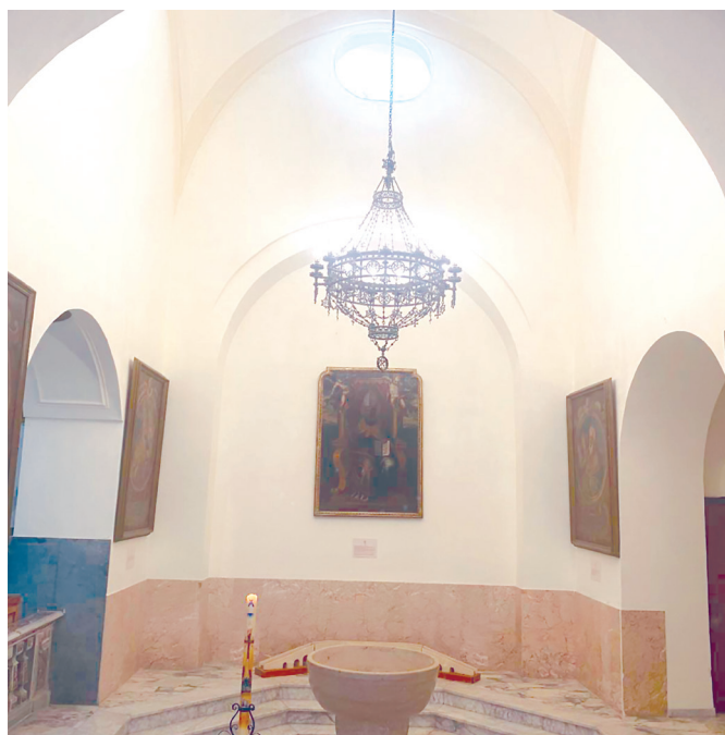
Cappella del Battistero: i quadri dei primi Vescovi di Canosa