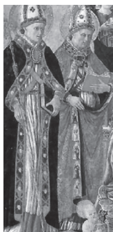
San Giovenale e San Sabino

L'opera « Madonna and Child Enthroned with Saints and Angels » è una tempera in oro su tavola di dimensioni cm. 186,5 (altezza) x 162 (larghezza) , dove il Vescovo Savino è il secondo da sinistra con un piviale adorno di santi accanto a San Giovenale. Essa è la «testimonianza di una devozione condivisa, diffusa e radicata» a