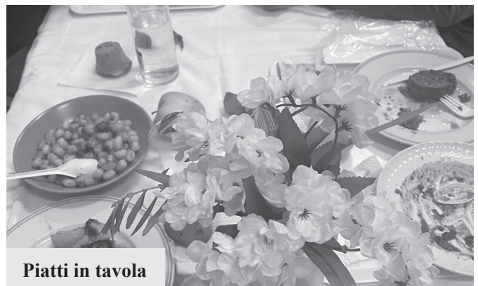
Piatti in tavola

di impegno e di volontariato che nel corso degli anni sono fiorite in città, veramente mi stupisce la generosità dei tanti volontari di Casa Francesco! Ogni giorno, tranne la domenica, un gruppo dalle sei alle otto persone, si alterna nel cucinare, servire a tavola, o preparare l’asporto e ripulire tutto. È veramente una bellissima realtà che coinvolge a turno una settantina di persone! Conta ormai dieci anni l’operatività di Casa Francesco e, in base anche alla presenza variabile del numero dei migranti, offre dai 50 ai 70 pasti giornalieri alle persone che lo chiedono e che vengono accolti, canosini e stranieri residenti! Tra i volontari ci sono giovani e meno giovani, accomunati dalla stessa volontà di fare qualcosa per gli altri, sperimentando ogni giorno che veramente c’è più gioia nel dare che nel ricevere. È sorprendente quanto edificante, soprattutto in questo ultimo periodo di gran caldo, osservare i nostri volontari sudati, ma soddisfatti e sempre disponibili nell’offrire il loro servizio con il sorriso sulle labbra, senza far pesare il proprio disagio. Smentendo le iniziali e incaute affermazioni, a Canosa si può fare questo e molto altro ancora, se mossi da motivazioni profonde: vale per Casa Francesco e per diverse altre realtà cittadine,