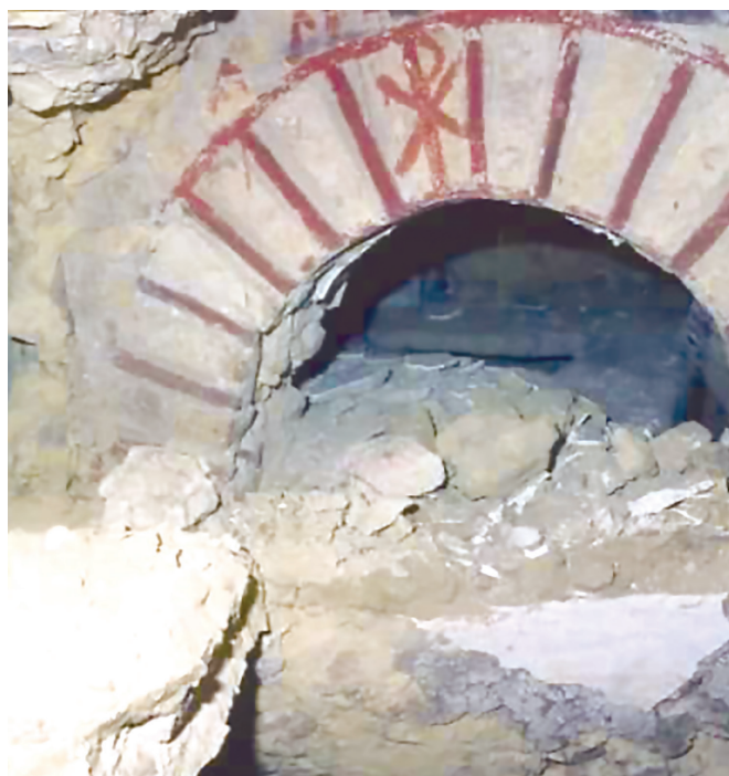
Le Catacombe di Santa Sofia

Anche il Vescovo Probo si spenderà per la strenua difesa della Fede cristiana e la tenace rivendicazione dei diritti della Sede romana, quindi del Vescovo di Roma. In seguito alla caduta dell'Impero Romano d'Occidente (476), Odoacre, re degli Eruli e fermo sostenitore dell'Arianesimo, invase il Regno d'Italia, mentre i Goti, ariani anch'essi, invadevano parte dell'Europa. Al trono dell'Impero Romano d'Oriente, dopo la morte dell'imperatore Leone, successe Zenone, anche lui eretico e persecutore della Chiesa. Papa Ilario (461-468) si servì molto dei consigli e dell'opera del Vescovo di Canosa, Probo, per risolvere questioni importanti riguardanti l'elezione dei vescovi da parte del Papa, e quindi relative al rapporto tra Roma e le altre Chiese: "Godette di alta considerazione negli ambienti ecclesiastici romani, che ne apprezzarono evidentemente le doti culturali, la vivacità e le capacità dialettiche, qualità che furono messe a frutto nel contesto dei difficili rapporti tra Occidente e Oriente." (p.158). L'imperatore d'Oriente e il Patriarca di Costantinopoli, dopo la fine