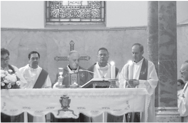
Concelebrazione Eucaristica presieduta dal Vescovo

E questo, nelle situazioni e nelle decisioni importanti che la vita ci chiama a prendere, ma anche nell'ordinarietà dello scorrere della vita quotidiana in quelle che sono le situazioni che attraversano la nostra vita di credenti e, per noi ministri ordinati, la nostra vita di guide e di educatori del popolo affidato alle nostre cure pastorali.