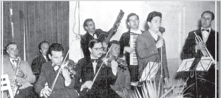
Copertina Calendario: tra le prime esibizioni canore di Lino Banfi

BANFI, giovanissimo, mentre canta e si esibisce con grande disinvoltura durante una festa: nulla lascia presagire la lunga e straordinaria carriera