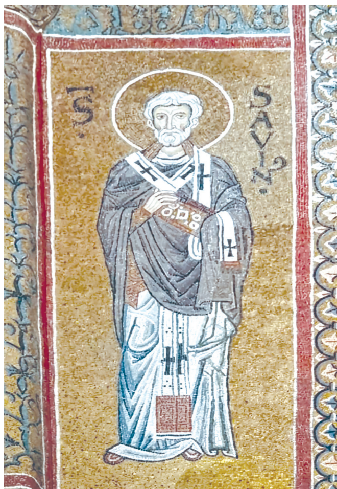
Duomo di Monreale (Palermo), mosaico di San Sabino

Vorrei ancora soffermarmi soprattutto sull'importanza del-