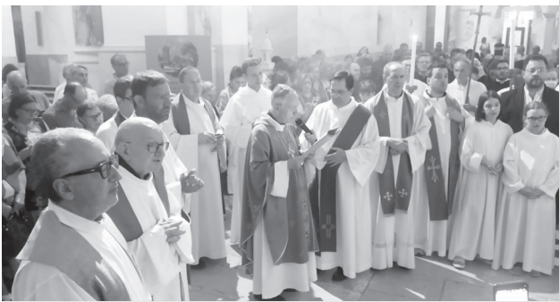
Preghiera davanti alla tomba di Padre Losito

Su queste vie l'ha seguito fino alla morte Padre Losito, donandosi senza risparmiarsi e divenendo così faro luminoso per le generazioni di quanti ha formato con il dono