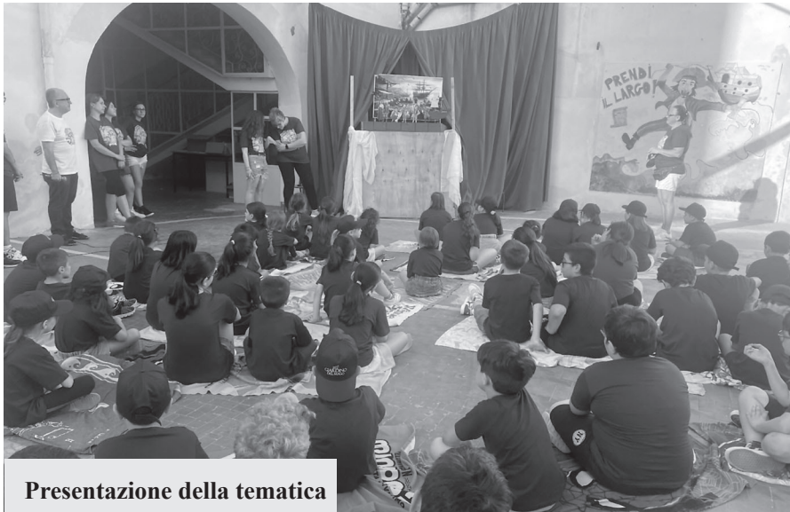
Presentazione della tematica

L’intento dell’oratorio estivo è quello di tenere bambini e ragazzi lontani dal-