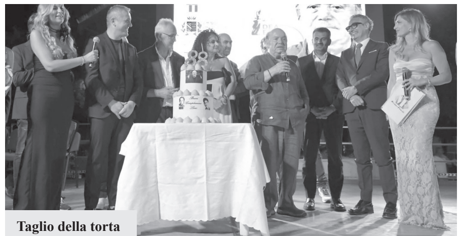
Taglio della torta

dura gavetta, riesce ad ottenere la tanto