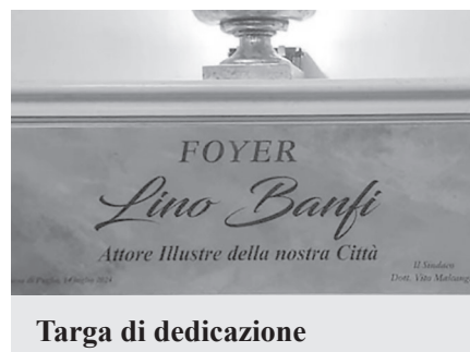
Targa di dedicazione

origini pugliesi, si trasferisce in gioventù a Milano e, solo dopo diversi anni di