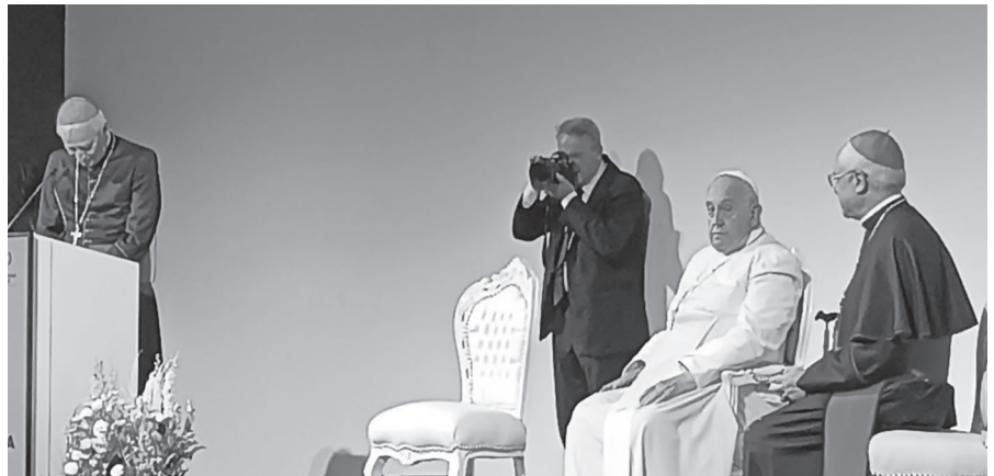
Papa Francesco, Mons. Luigi Renna e Mons. Matteo Zuppi

si svegli dal sonno del consumismo e dell'indifferenza. Particolare risalto e consenso ha avuto l'incontro-autoconvocazione degli amministratori locali presso l'aula del Consiglio regionale del Friuli-Venezia Giulia, i quali hanno dato vita alla “Rete Trieste” , una sorta di bussola che li impegna a convergere sui valori cristiani, pur nelle differenze