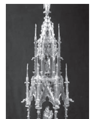
Reliquiario del cranio di S. Sabino