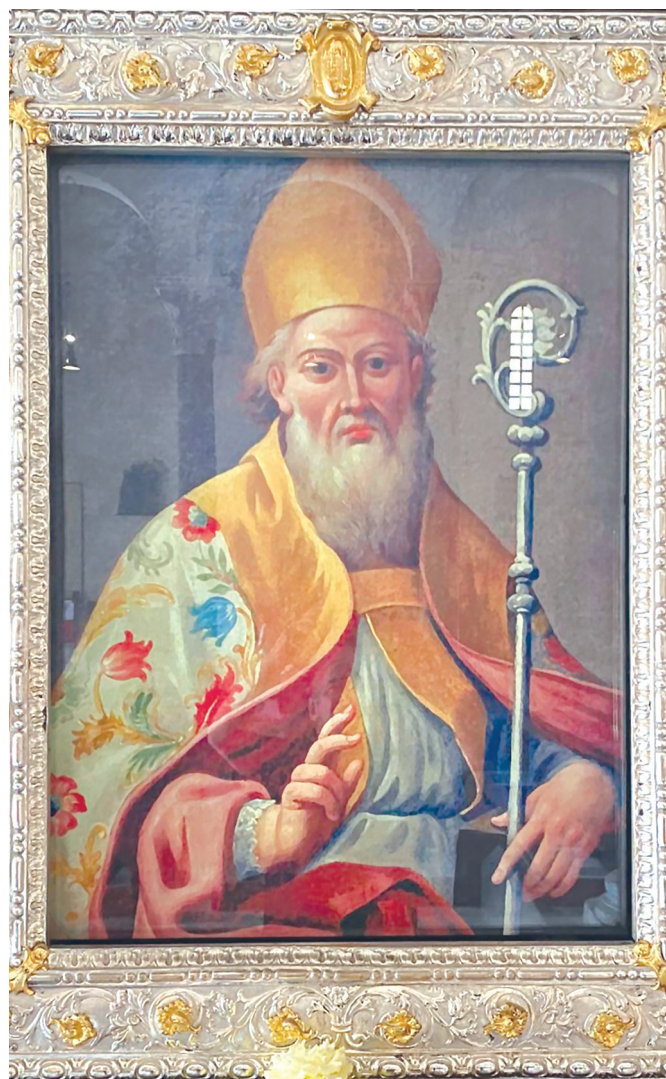
L'immagine di San Sabino venerata a Bari