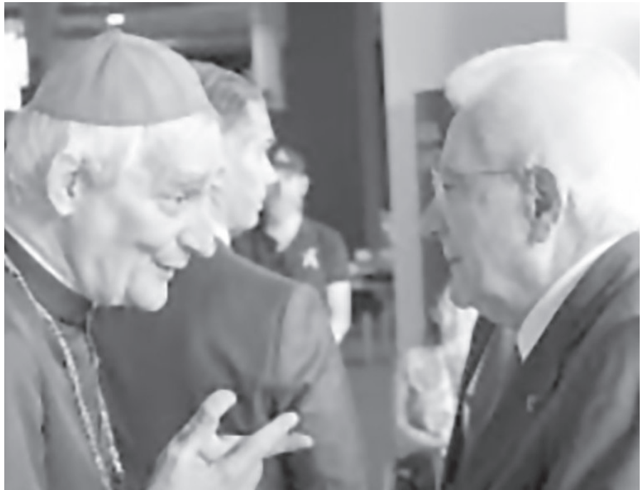
Il Presidente della Repubblica Mattarella con S.E. Mons. Matteo Zuppi

Anche per questo l'esercizio della democrazia non si riduce a un semplice aspetto procedurale e non si consuma neppure soltanto con la irrinunciabile