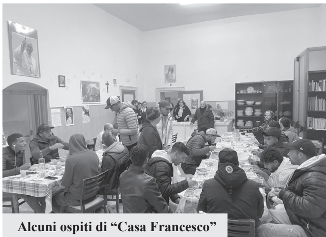
Alcuni ospiti di “Casa Francesco”

Associazioni, Fondazioni, Gruppi organizzati, che operano spesso in silenzio, con discrezione e passione perché amano sinceramente la propria città e che preferiscono, rifiutando la “comoda lagna”, rimboccarsi le maniche!