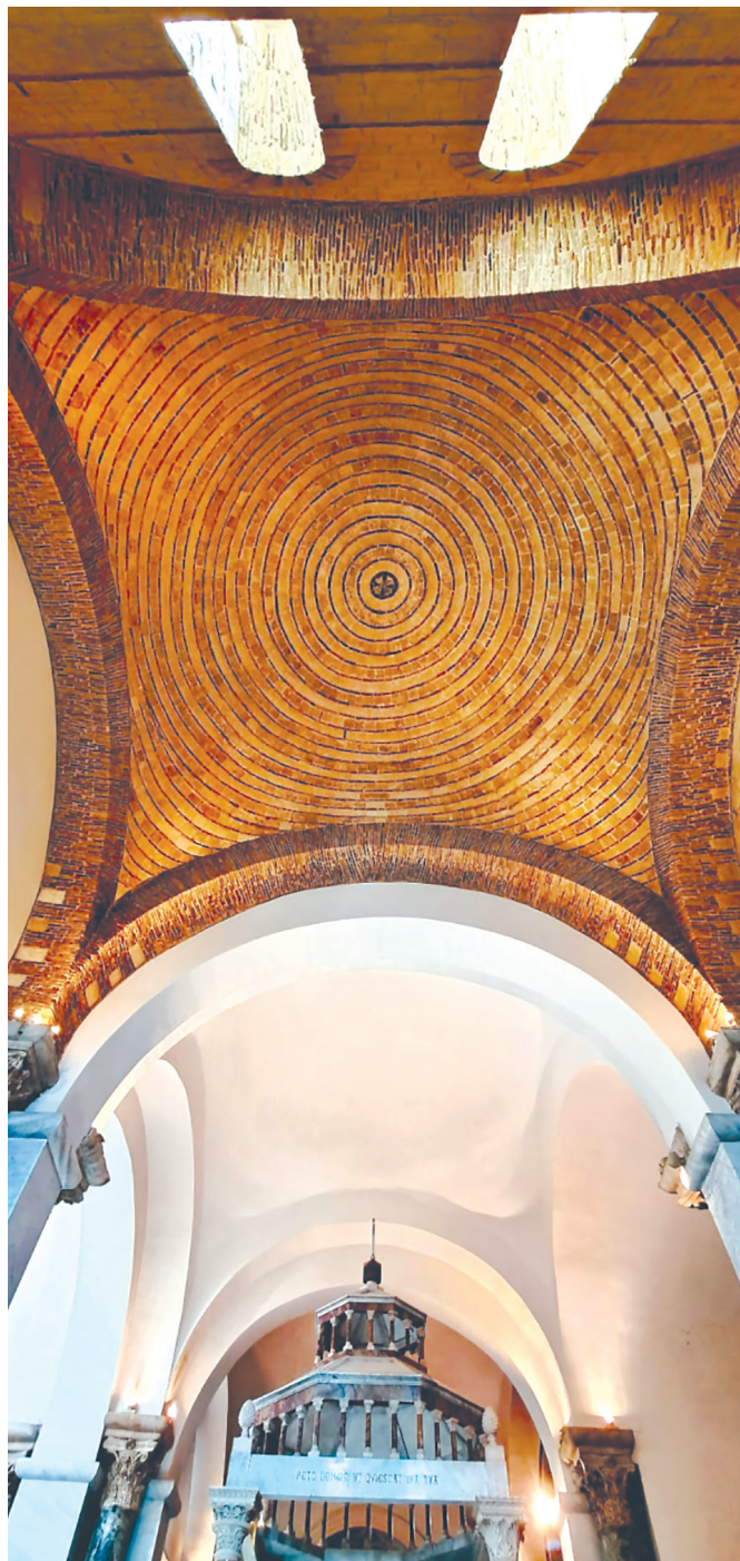
Cattedrale di Canosa